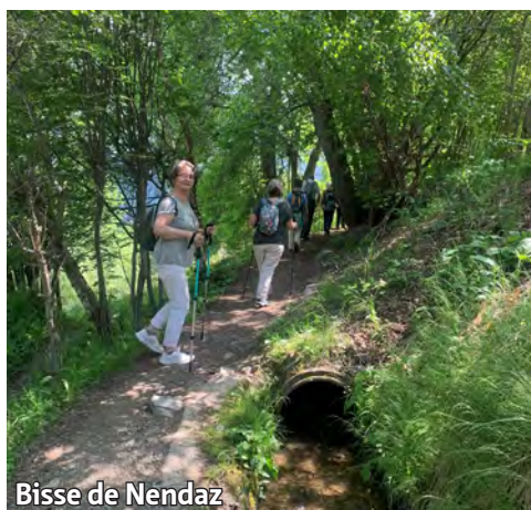
Bisse de Nendaz